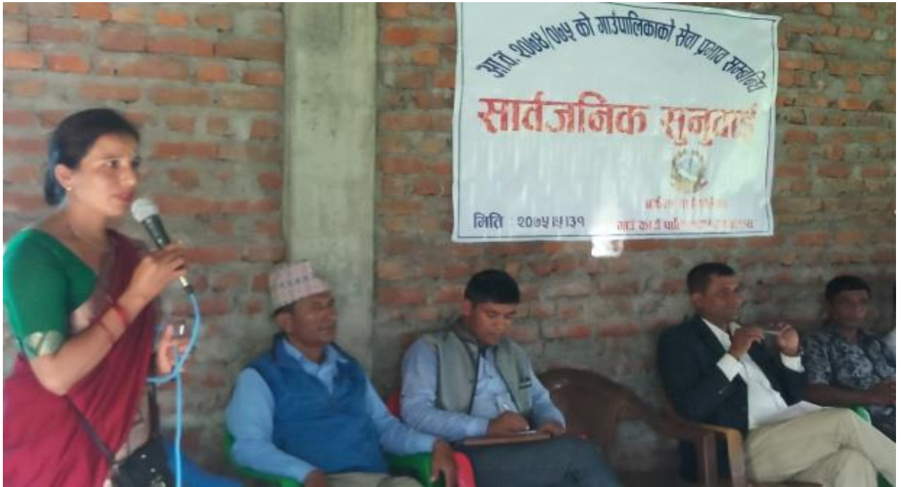
गापा उपाध्यक्ष स्वागत मन्तव्य दिँदै