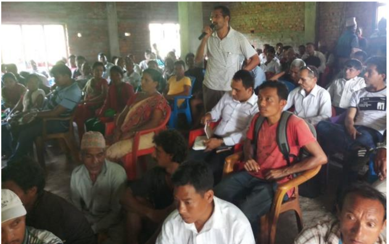
सहभागी द्वारा कार्यक्रममा प्रश्न राख्दै